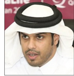
سعادة الأستاذ فيصل راشد الضهيدة مساعد الرئيس التنفيذي لقطاع العمليات والشراكات الدولية بجمعية قطر الخيرية