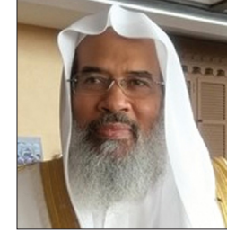
سعادة الشيخ أحمد الصبان وكيل وزارة الشؤون الإسلامية سابقا بالمملكة العربية السعودية