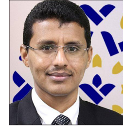
سعادة الدكتور صالح مبارك بازياد الرئيس التنفيذي لمؤسسة نماء الدولية - ماليزيا