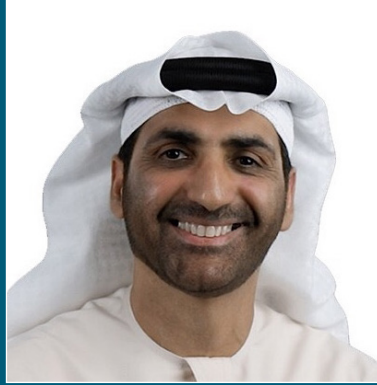
سمو الشيخ الدكتور عبد العزيز بن علي النعيمي الرئيس التنفيذي لجمعية الإحسان الخيرية بعجمان السفير الدولي للمسؤولية المجتمعية ضيف شرف المؤتمر