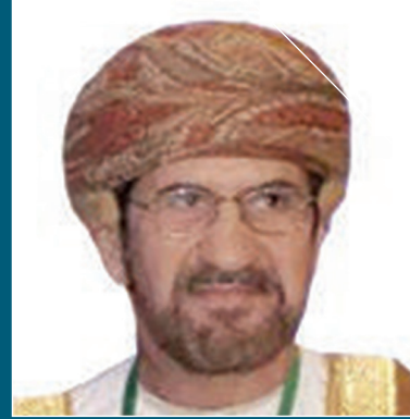
المكرم الشيخ علي بن ناصر المحروقي عضو مجلس الدولة بسلطنة عمان السفير الدولي للمسؤولية المجتمعية الراعي الفخري للمؤتمر