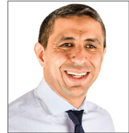
سعادة المستشار غياث خليل هوراي مستشار التطوير القيادي والاستراتيجيات